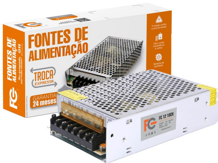
Fonte Colmeia 12V 10A